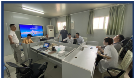
贵州省医保局到应用现场调研