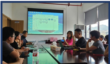
贵州省医保局组织召开协调会

在测试期间，一开始数据上传工作遇到了软件字段、格式等不符情况，需要对上传数据进行修正。通过贵州省医保局主持多次讨论会，顺利解决了数据上传过程中各种技术难题。